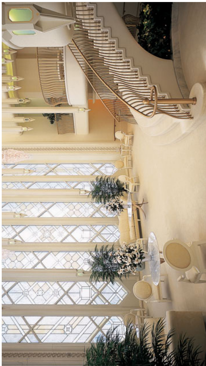
해의 왕궁실, 캘리포니아 샌디에이고 성전