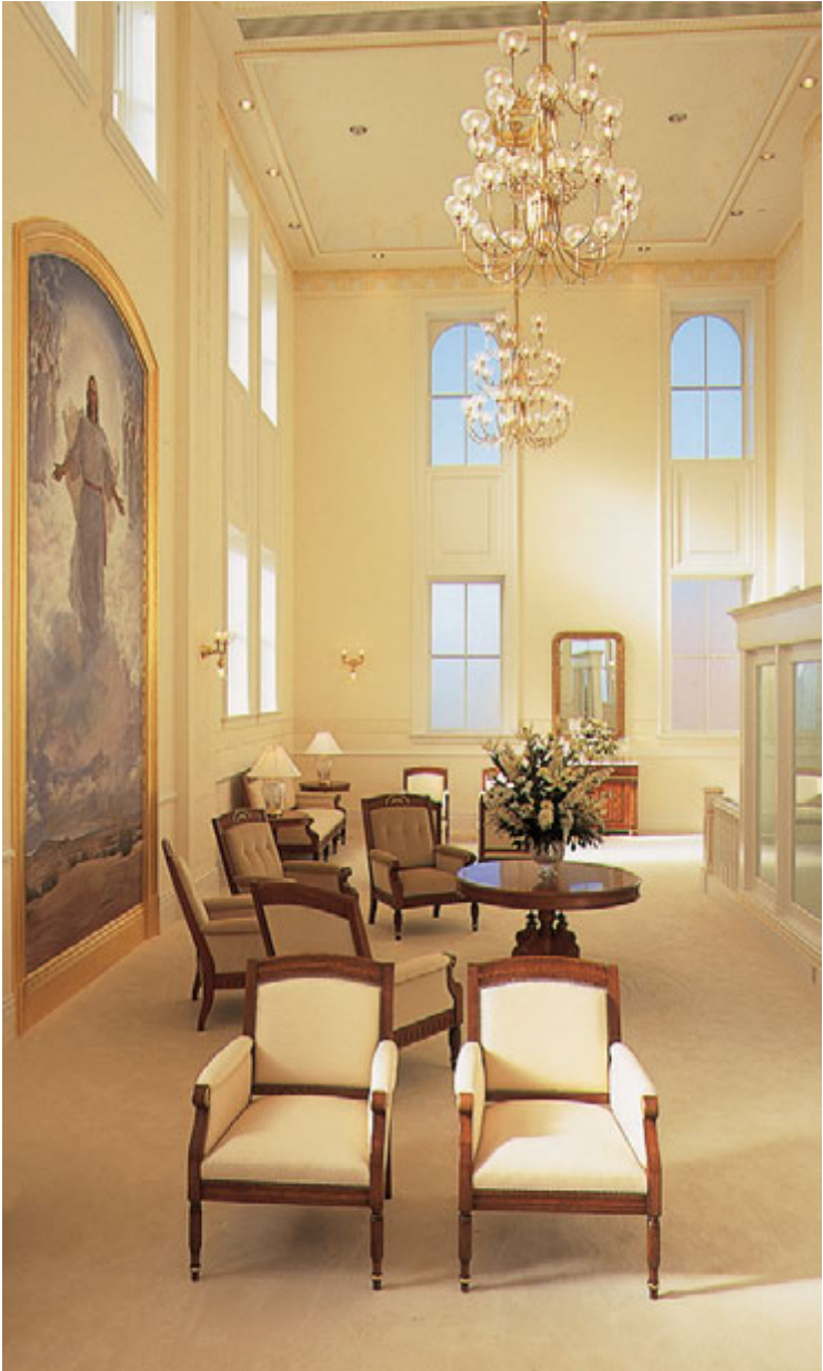
해의 왕국실, 유타 버널 성전